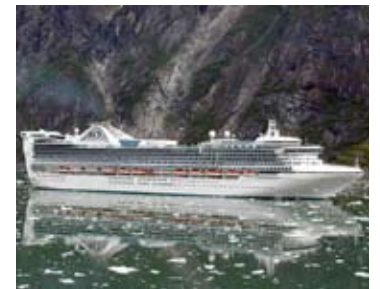
Provocación: La administración británica impidió la entrada a Islas Malvinas de un crucero con turistas argentinos.

Esta preocupación por la falta de resolución de la cuestión de las Islas Malvinas es compartida por la inmensa mayoría de la comunidad internacional. En particular, nuestros dos países han sido instados a reanudar negociaciones por los principales órganos regionales (Mercosur, Unión de Naciones Suramericanas, la Comunidad de