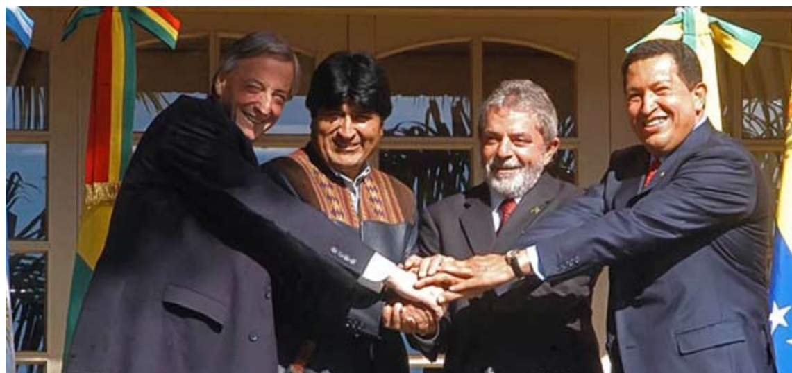
El proyecto latinoamericano de Perón se consolida en la nueva realidad de la región.

dente había puntualizado: He dicho muchas veces, lo he dicho públicamente y lo sostendré públicamente que nuestro país está total y absolutamente preparado para esa unión. Hemos dicho que estamos a disposición de los que quieren unirse, que nosotros estamos convencidos de esa necesi-