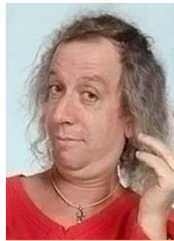
Diego Capusotto, humor político con sentido crítico.

Pero lo que ustedes expresan artísticamente no tiene solo que ver con lo político sino casi con lo existencial