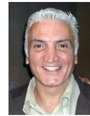
Por Juan Carlos Dante Gullo*

El Gobierno de Mauricio Macri ha inaugurado el año con una medida que además de ser marcadamente antipopular, resulta por donde se la mire inconsulta, arbitraria e irresponsable. El intempestivo aumento de la tarifa del pasaje de los subterráneos de la CABA ha llevado el valor del viaje de $ 1,10 a $ 2,50, esto es, lo ha incrementado en un porcentaje del 127%, con la consecuente afectación del bolsillo de los millones de pasajeros que transitan diariamente por ese medio.