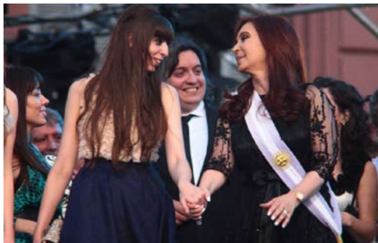
La Presidenta está en franca recuperación junto a su familia.