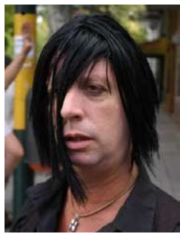
El Emo, otro de los celebrados personajes de Capusotto.

D.C.: Sí, ya ganó dos veces, o tres. No es tampoco para desecharlo pensando que es una