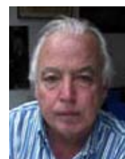
Por Roberto Baschetti*

Algunos datos a tener en cuenta: 1) Las instalaciones del frigorífico estaban valuadas en alrededor de 1.000 millones de pesos de entonces. 2) Por día se faenaban un millón y medio de kilogramos de carne vacuna para consumo. 3) En las tareas trabajaban 9.000 obreros y se sabía que los nuevos dueños iban a "racionalizar" el personal; cosa que así sucedió porque so-