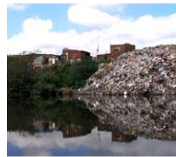
Basurales y putrefacción en el Riachuelo, un proceso a revertir.

La formidable oportunidad de realizar una de las obras públicas más importantes de esta generación debe tener una mirada humanista. Para la recuperación del medio ambiente, de los ecosistemas, del camino de sirga o el traslado de población asentada en los márgenes, para mejorar la salud y solucionar los problemas de contaminación al pueblo,