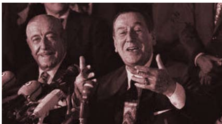
Perón, un visionario que se anticipó a los tiempos que vivimos.

res coexistentes en el mundo la miseria y la abundancia, la paz y la guerra. El documento Por la cooperación económica y la paz mundial fue enviado por la Cancillería argentina a los gobiernos hispanoamericanos y a la Santa Sede.