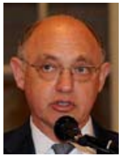
Por Héctor Timerman*

La Argentina y Gran Bretaña son democracias cuyas respectivas capacidades hoy día se miden por su capacidad de diálogo y negociación para resolver las disputas. Hoy en día no hay espacio para rechazar el diálogo. Mi país se ha comprometido a alcanzar una solución pacífica del conflicto que respete la forma de vida de los isleños, este compromiso está recogido en nuestra Constitución.