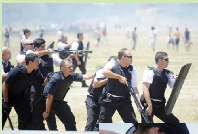
En el conflicto de la toma del Parque Indoamericano, Macri promovió la represión policial y el enfrentamiento entre los vecinos, con un dramático saldo de muertos y heridos.

En contraposición, el Ministerio de Desarrollo Social censó a todos los participantes de la toma y solucionó los problemas más acuciantes. El gobierno nacional también resolvió el conflicto del Parque Indoamericano en forma pacífica y sin incidentes.